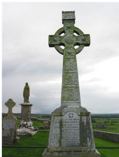
Rock of Cashel, Irland